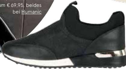
< SPORTLICH Slipper von GAMLOONG bei Humanic um € 59,95