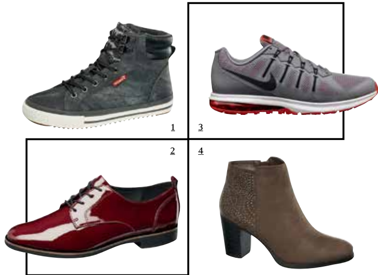
1 / MIDCUT SNEAKER in Grau mit kontrastierender weißer Sohle bei Deichmann um € 29,90

angesagte Look auch in diesem Herbst: Sneakers in allen Styles und Variationen – und satte Brauntöne bei Boots und Schnürern, von edlen Maroni- und Bordeaux-Tönen bis zu mattem Rauleder in Naturfarben.