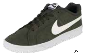
ROYAL COURT von Nike bei Humanic um € 59,95