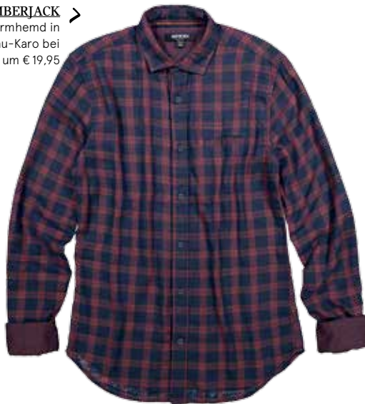
LUMBERJACK > Langarmhemd in Rot/Blau-Karo bei NEW YORKER um € 19,95