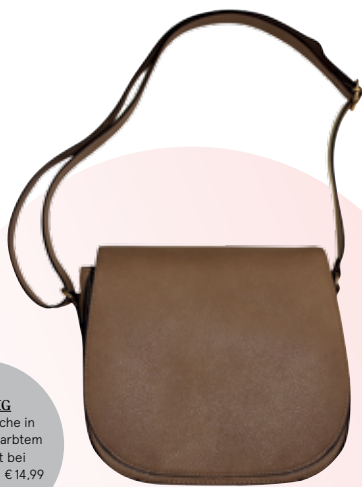
ZÜNFTIG Umhängetasche in braunem, genarbttem Lederimitat bei Colloseum um € 14,99