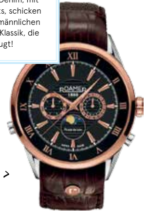
ZEITMESSER > Roamer „Superior Moonphase“ Chrono bei Diadoro um € 349,-

Die Fashion-Shops des M4 Wörgl haben alles, was echte Kerle in diesem Modeherbst brauchen: Authentisch und maskulin ist der Look, mit viel Plaid und Denim, mit schweren Boots, schicken Sneakers und männlichen Accessoires – Klassik, die überzeugt!