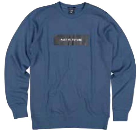
STREET STYLE > Rundhals-Sweater in Blau bei NEW YORKER um € 9,95

Die neuen Fashion-Stores machen das rundum modernisierte M4 Wörgl zum coolen Mode-Mekka für Markenfans – mit den schönsten Looks für den Herbst!