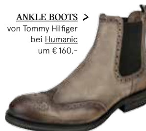
ANKLE BOOTS > von Tommy Hilfiger bei Humanic um € 160,-