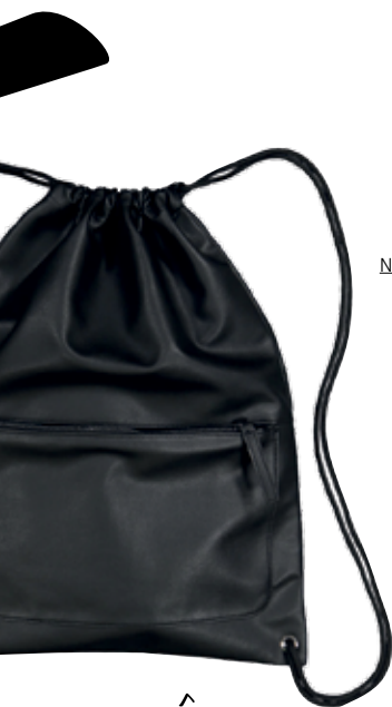
SPORTSMAN Turnbeutel in Schwarz bei NEW YORKER um € 9,95