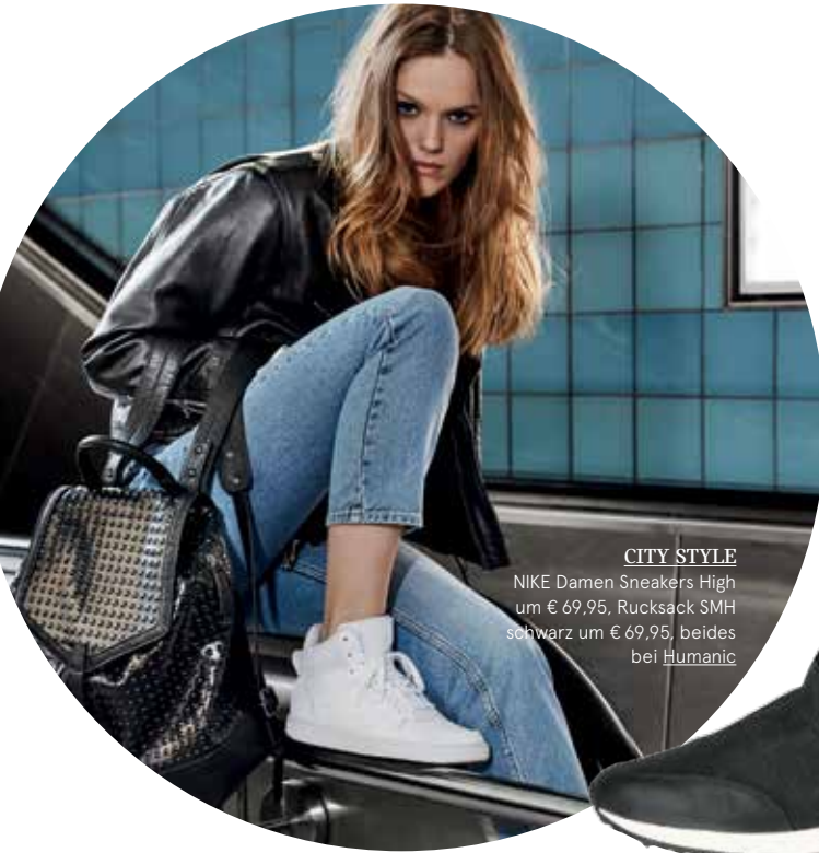
CITY STYLE NIKE Damen Sneakers High um € 69,95. Rucksack SMH schwarz um € 69,95, beides bei Humanic

Humanic hat die neuen Schuh- und Accessoire-Trendteile.