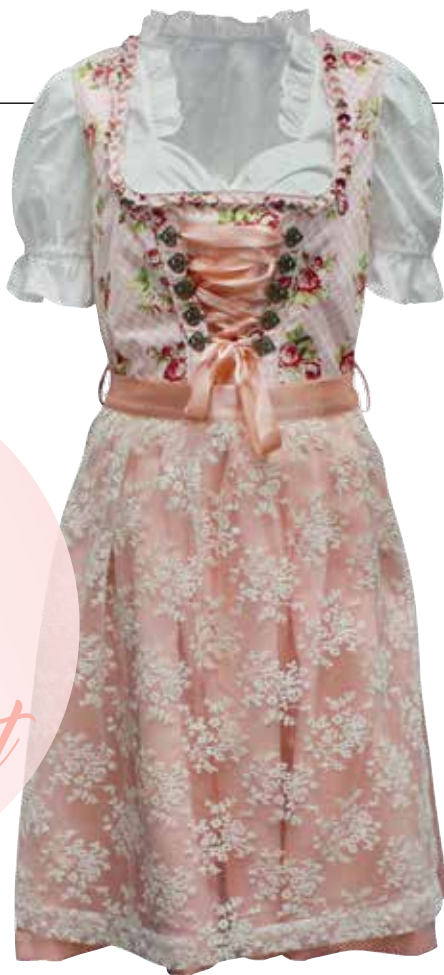
TRACHTIG Dirndkleid in Pfirsich bei Colloseum um € 49,99