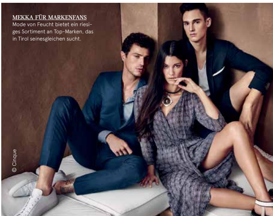
MEKKA FÜR MARKENFANS Mode von Feucht bietet ein riesiges Sortiment an Top-Marken, das in Tirol seinesgleichen sucht.

Für ein völlig neues Mode-Beratungserlebnis sorgt der Service-Button in den Umkleidekabinen – der erste Service dieser Art in Tirol. Ein Knopfdruck genügt, und schon sind die freundlichen ModeberaterInnen zur Stelle, um Sie bei der Auswahl der für Sie optimal passenden Größen und Schnitte zu unterstützen und für Sie das perfekte Outfit für jeden Anlass zu finden!