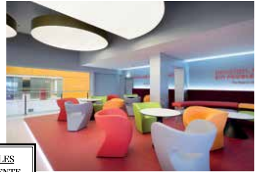
COOLES AMBIENTE Die Lounge-Zone und die Snackbar sorgen für relaxtes Kinofeeling pur!

Riesenauswahl an süßen und pikanten Knabbereien sowie kühlen Drinks für das ultimative Popcorn-Kinofeeling. Selbstverständlich verfügen alle 6 Säle des Cineplexx über perfekten Sitzkomfort und modernste Technik, sind vollklimatisiert und mit den fortschrittlichsten digitalen Tonsystemen für hautnahes Kinoerlebnis ausgestattet!