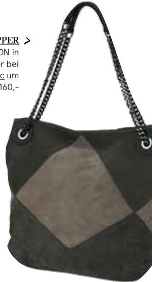
SHOPPER > von VIGNERON in Veloursleder bei Humanic um € 160,-