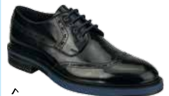
BUDAPESTER von Pat Calvin bei Humanic um € 99,95