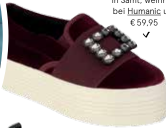
SLIPPER in Samt, weinrot, bei Humanic um € 59,95 ✓