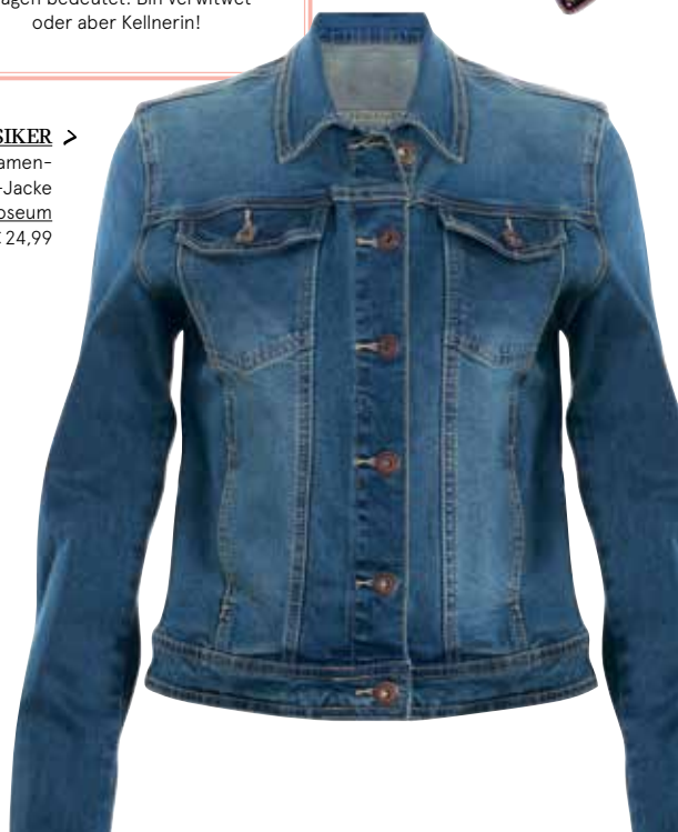
KLASSIKER > Cooles Damen-Denim-Jacke bei Colloseum um € 24,99

STYLING-TIPP Psst, Geheimtipp! Auf www.mycolloseum.com ist Saskia Atzerodt nicht nur in der neuen Colloseum-Oktoberfest-Kollektion zu bewundern, sie gibt auch Tipps fürs korrekte Trachten-Outfit und die besonderen Zeichen. Denn Dirndlschleife rechts bedeutet: Bin schon vergeben oder verheiratet. Schleife links heißt: Bin Single, Flirten ist erlaubt. Und Dirndlschleife hinten getragen bedeutet: Bin verwitwet – oder aber Kellnerin!