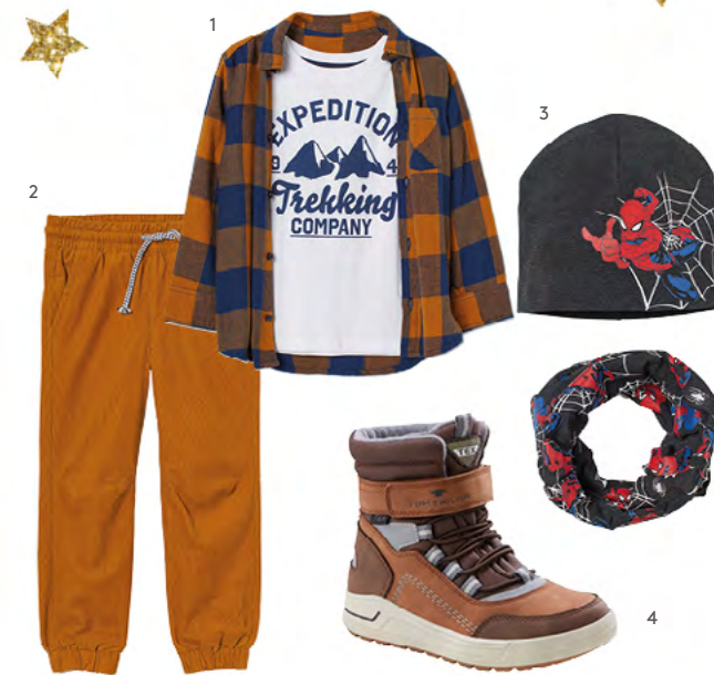
1. SHIRT MIT HEMD bei H&M um €19,99 2. CORD-JOGGERS bei H&M um €15,99 3. SET AUS MÜTZE UND SCHAL bei H&M um €14,99 4. SCHUHE bei MyShoes um €39,99