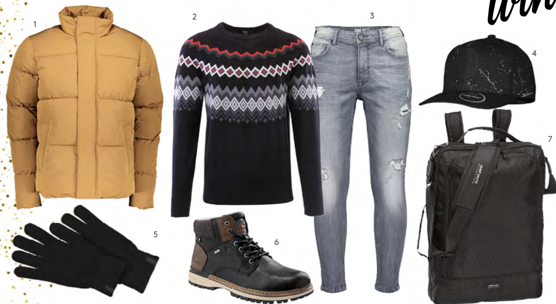
1. JACKE bei New Yorker um €39,99 2. PULLOVER bei Fussl um €39,99 3. HOSE bei New Yorker um €29,99 4. KAPPE bei New Yorker um €9,99 5. HANDSCHUHE bei New Yorker um €2,99 6. BOOTS bei MyShoes um €49,99 7. RUCKSACK bei Deichmann um €34,99