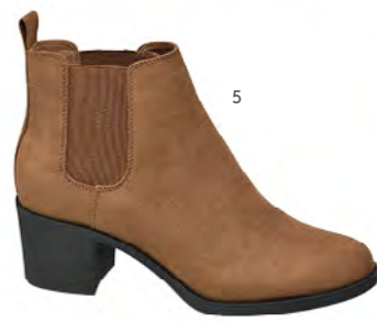
1. TASCHE bei Deichmann um € 49,99 2. STIEFELETTEN bei Deichmann um € 69,99 3. STIEFELETTEN bei MyShoes um € 55,99 4. STIEFELETTEN bei MyShoes um € 55,99 5. STIEFELETTEN bei Deichmann um € 29,99