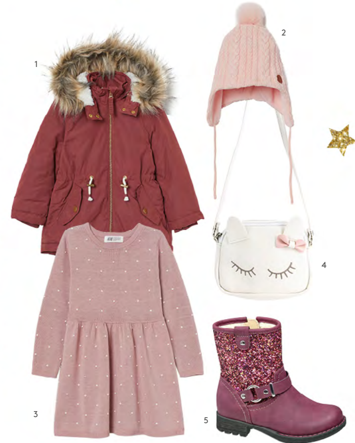
1. PARKA bei H&M um €34,99 2. ZOPFSTRICKMÜTZE bei H&M um €9,99 3. STRICKKLEID bei H&M um €17,99 4. TASCHE bei Bijou Brigitte um €14,95 5. STIEFEL bei Deichmann um €24,99