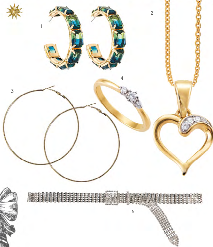
1. OHRSTECKER bei Bijou Brigitte um € 24,95 2. HALSKETTE MIT ANHÄNGER bei Diadoro um € 149,- 3. CREOLEN bei New Yorker um € 1,99 4. RING bei Diadoro um € 599,- 5. STRASS-GÜRTEL bei New Yorker um € 12,99