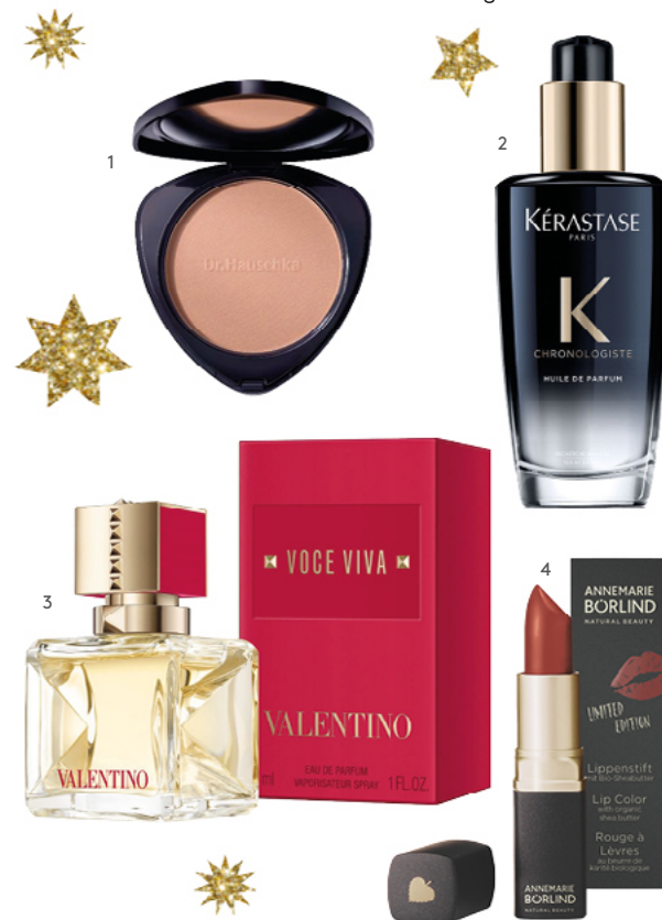
1. DR. HAUSCHKA BRONZING POWDER bei reformstark Martin um € 26,50 2. KÉRASTASE KERA HUILE DE PARFUM 100 ml bei Daniel's Haare um € 38,90 3. VALENTINO VOCE VIVA EAU DE PARFUM 30 ml bei Müller um € 66,95 4. LIPPENSTIFT bei Müller um € 14,95

An den Feiertagen wirft man sich gern in Schale und nimmt sich Zeit für Make-up und Haarstyling. Macht Euch am besten selbst ein verfrühtes Weihnachtsgeschenk und schaut im Friseurstudio vorbei – ein neuer Schnitt hebt die Laune! Außerdem werdet Ihr dort gut beraten, wie Ihr Eure Haare richtig pflegt und stylt. Was übrigens auch unbedingt dazugehört: ein betörender Duft – den man sich natürlich auch schenken lassen kann ... Einfach dem Christkind Bescheid sagen!