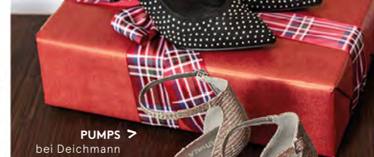
PUMPS bei Deichmann um € 27,99