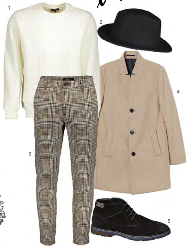
1. PULLOVER bei New Yorker um €14,99 2. HUT bei New Yorker um €12,99 3. HOSE bei New Yorker um €29,99 4. MANTEL bei H&M um €79,99 5. SCHNÜRER bei Deichmann um €39,99